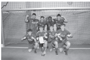
Sieger Aktive: "Cuba Libero"

Das Turnier der Aktiven gewann erstmals das junge Team „ Cuba Libero “ in einem packenden und emotionsgeladenen Finale gegen Seriensieger „Hoba Crew“ nach Neunmeterschießen. Die weiteren Plätze belegten „SSV Ulmer Schorle“,