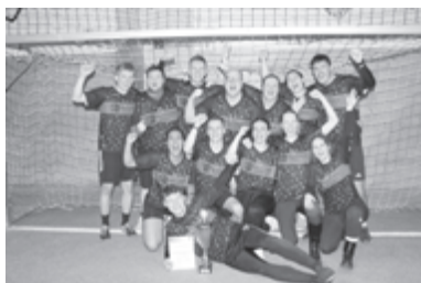
Sieger Hobby: "Kenned nix"

Hobbymannschaften, wie man mit dem Ball umgeht. Bis auf kleinere Blessuren blieb das Turnier durchgehend fair. Am Ende gab es zur großen Freude auch zwei neue Siegermannschaften. Bei den Hobbykickern setzte sich erstmals das Team „ Kenned nix “ im Finale gegen den SVR Ausschuss durch. Auf den weiteren Plätzen landeten die „Feuerwehr“, „Ortschaftsrat“, „Polkabomber“ und „Darts Club Zentrale“.