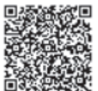
Klick auf QR Code