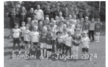
Bambini & F-Jugend 2024

Wir freuen uns schon auf weitere gemeinsame Unternehmungen, die die Gemeinschaft der Kleinen und deren Eltern weiter stärkt.