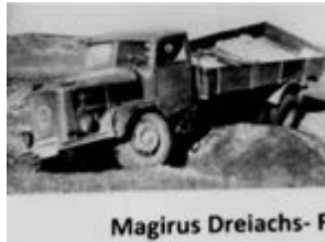
Magirus Dreiachs- F

Hier noch ein historisches Bild, für welche Fähigkeiten, außer Flugzeuge zu schleppen, ein Magirus S3000 eigentlich konstruiert war.