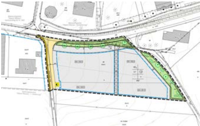
Ausschnitt Bebauungsplan „Obere Wiesen II – 2. Änderung“ vom 20.07.2021 / 20.12.2021 / 25.04.2022, unmaßstäblich, genordet

Im Einzelnen gelten für den Bebauungsplan und die örtlichen Bauvorschriften die Planzeichnung, die textlichen Festsetzungen (planungsrechtlicher Teil) und die örtlichen Bauvorschriften des Ing.- Büros WASSERMÜLLER ULM GmbH mit dem Datum vom 20.07.2021 / 20.12.2021 / 25.04.2022 einschließlich Begründung. Der Bebauungsplan und die örtlichen Bauvorschriften „Obere Wiesen II – 2. Änderung“ i. d. F. vom 20.07.2021 / 20.12.2021 / 25.04.2022 treten mit der öffentlichen Bekanntmachung in Kraft. Der Bebauungsplan und die örtlichen Bauvorschriften mit Begründung und Satzungsbeschluss werden im Rathaus der Stadt Erbach, Erlenbachstraße 50, 89155 Erbach zu den ortsüblichen Öffnungszeiten zu jedermanns Einsicht bereitgehalten. Über deren Inhalt wird auf Verlangen Auskunft erteilt.