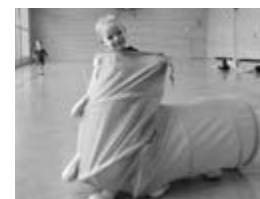
Die kleine Raupe Nimmersatt war mit von der Partie...

"Schuhuuu ...mit meiner langjährigen Walderfahrung kann ich das nur unterstreichen...!"