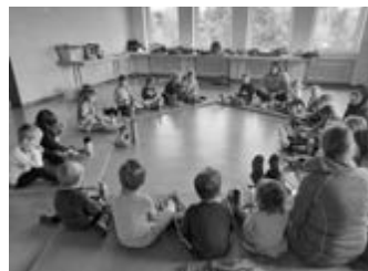
Vespers in der großen Runde...

Auch der Waldkindergarten musste sich in der vergangenen Woche "sturmsicher" machen und konnte die Zeit glücklicherweise im Ausweichquartier Bacher Mehrzweckhalle überbrücken. Wie man auf den Bildern sieht, ist es für die Kinder nicht nur eine Notlösung , sondern sogar eine regelrechte Attraktion, der sie immer viel abgewinnen können!